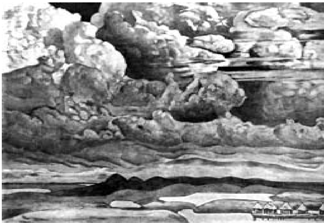
Н. К. Рерих. Небесный бой. 1912 год